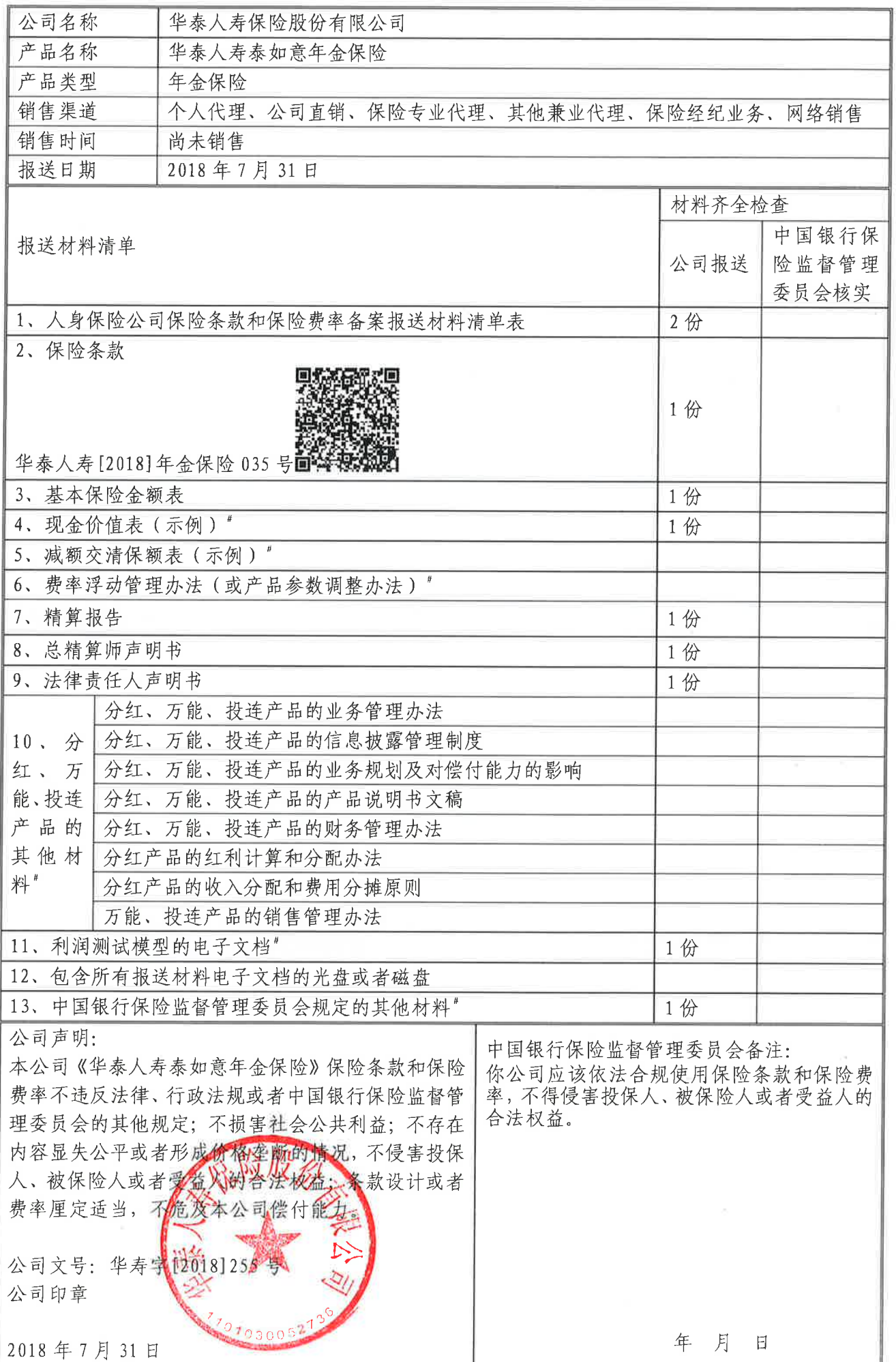
人身保险公司保险条款和保险费率备案报送材料清单表